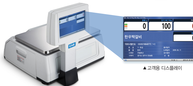
▲ 고객용 디스플레이